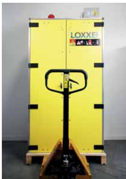
LOXK1850 - Imanevrare usoara, amplasare