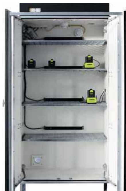
LOXK1850 - Loxxer 1850 interior dulap