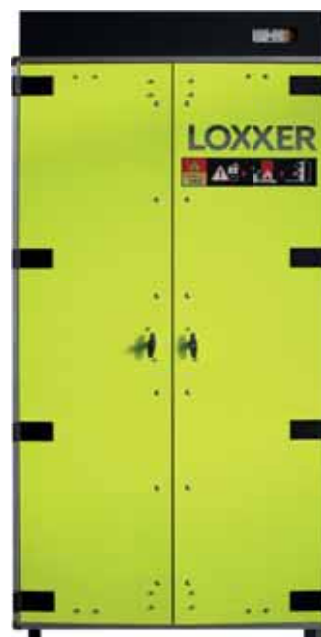
LOXX1850 - Loxxer 1850